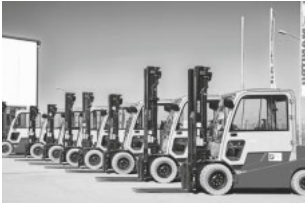
Das umfangreiche Angebot der Firma UF Gabelstapler GmbH

Um die internen Abläufe weiter zu optimieren, wurde 2023 entschieden, die Lackierung vollständig nach Hohentengen zu verlagern und die Werkstatt in Herbertingen aufzulösen. Die dortigen Mitarbeiter wurden in den Hauptstandort integriert .