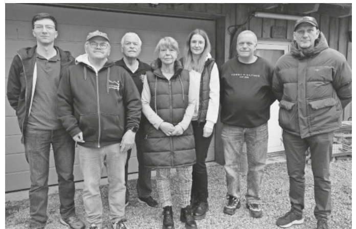
Die neue Vorstandschaft