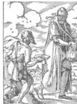
Der Geldnarr, Holzschnitt von Jost Ammann, 1568

Aus den vorliegenden Unterlagen geht hervor, dass der Bettel (Anm.: angeblich) seine Ursachen im Müßiggang , einem der schändlichsten Laster der Menschheit habe. Es solle keinem Untertanen erlaubt sein, Weib oder Kind zum Betteln auszuschicken. Die Kinder sollen, sobald sie hinlänglich Größe und Kraft haben, zu vermögenden Leuten in Dienst geschickt werden, soweit sie nicht zuhause beschäftigt werden können. Die Gemeinden sollen dafür sorgen, dass mittellose Leute zu Holz- und Feldgeschichten herangezogen werden und durch Arbeit so zu Verdienst kommen, dass sie das Betteln nicht nötig haben.