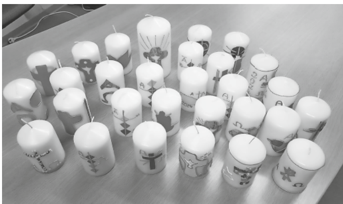
Es sind viele Kerzen mit österlichen Motiven entstanden.