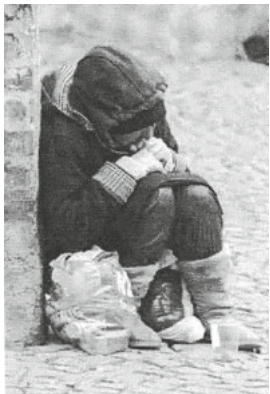
Bettlerin in einer deutschen Großstadt (2014)

„Bettelsack wird nimmer voll, wie man ihn füllt, so bleibt er hohl“.