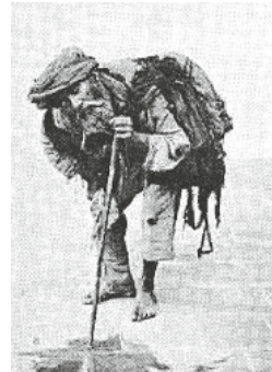
Bettler in Teheran um 1880

Bettler sind Menschen, die ihren Lebensunterhalt ganz oder teilweise aus Almosen (milden Gaben anderer) bestreiten. Meistens wird um Geld gebettelt. Einige betteln gezielt vor religiösen Stätten, da die Gaben von Almosen in vielen Religionen als erwünscht oder sogar als Pflicht der Gläubigen betrachtet wird. Ein Teil der Bettelnden ist zusätzlich von Obdachlosigkeit betroffen.